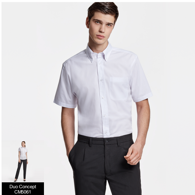
Duo Concept CM5061